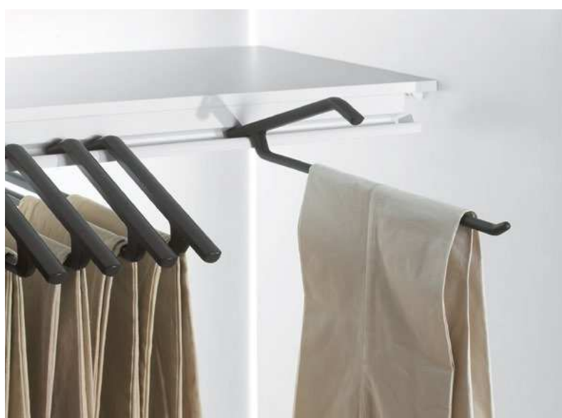
Porte-pantalons Lina : Afin de faciliter la pose du pantalon et d'avoir les deux mains libres, le cintre peut être fixé à l'étagère par l'arrière.