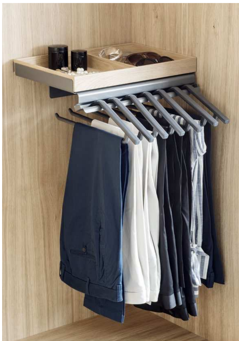
Porte-pantalons Lina et boîte en bois : Le nouveau support pour ranger vos pantalons sans plis.