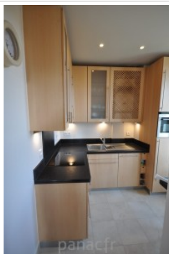
Meubles de cuisine entièrement en bois naturel