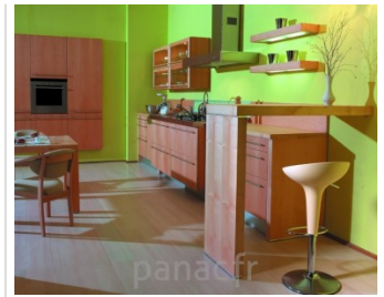
Meubles de cuisine entièrement en bois naturel