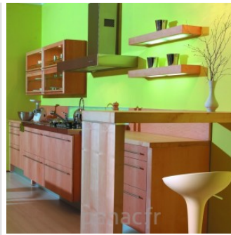
Meubles de cuisine entièrement en bois naturel