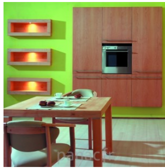
Meubles de cuisine entièrement en bois naturel