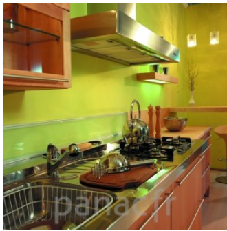
Meubles de cuisine entièrement en bois naturel