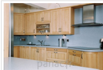
Meubles de cuisine entièrement en bois naturel