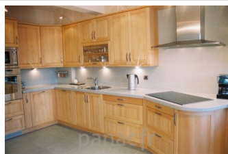
Meubles de cuisine entièrement en bois naturel