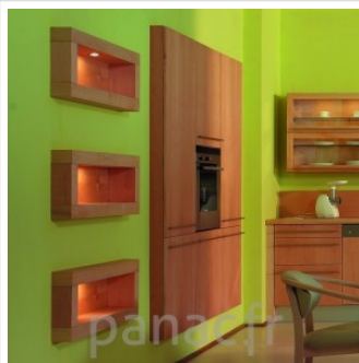
Meubles de cuisine entièrement en bois naturel