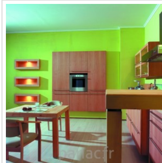
Meubles de cuisine entièrement en bois naturel