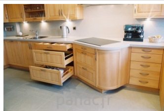
Meubles de cuisine entièrement en bois naturel