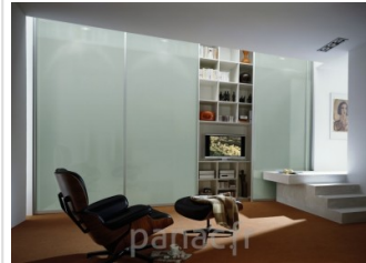
Rénovation, aménagement et décoration de votre intérieur